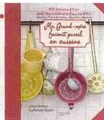
Ma Grand-mère faisait pareil en cuisine ● 14,16 €, Hachette Pratique