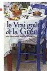
Le Vrai goût de la Grèce ● 32 €, éditions Aubanel