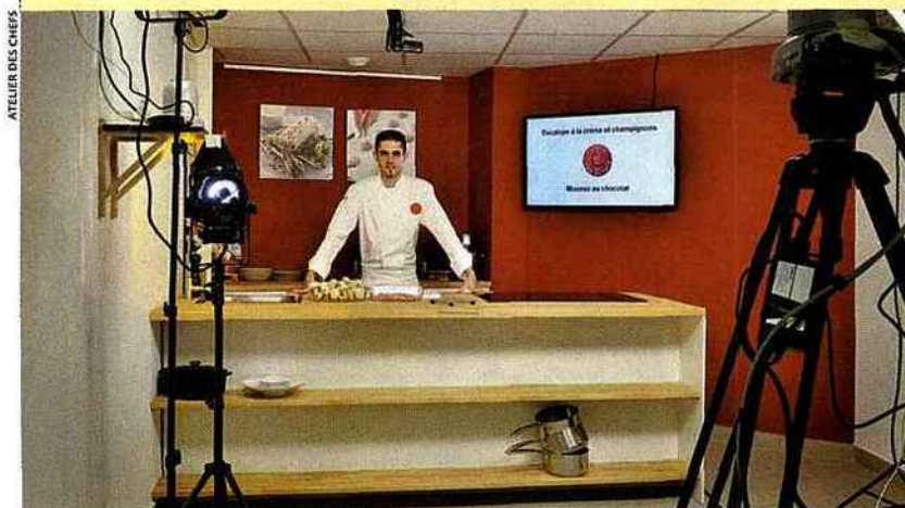
ATELIER DES CHEFS

Avec le nouvel épisode de Just Dance 4 d'Ubisoft, vos enfants vont bientôt être rejoints par vos voisins. Tout ce petit monde se déhanchera de manière endiablée sur quarante titres chantés par des artistes actuels (Justin Bieber) ou plus classiques (Elvis Presley) et mesurera ses aptitudes dans des chorégraphies alternatives (le niveau de difficulté varie). Et pourra même comparer les calories brûlées ! À noter qu'une version a même été développée pour la toute nouvelle console de Nintendo qui sera lancée prochainement, la Wii U. Just Dance 4 (Ubisoft) sur Wii, Xbox 360 et PS3, entre 31 et 45 € suivant la version. FRÉDÉRIC PAYA