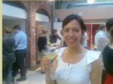
Un cocktail "à tomber": le bombay tokyo (recette dans un prochain message)