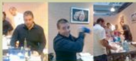
Préparation du "Bombay Milan": un cocktail à base de Gin, de menthe et de framboise