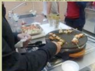
Petites brochettes de poisson mariné grillées, sauce aigre-douce