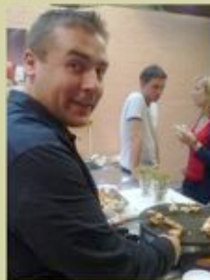
mon homme, dans son élément!